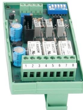
Аналоговый предельный переключатель, модель EGS01